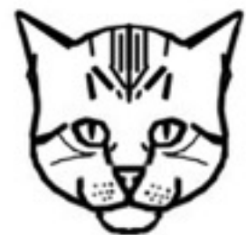
CONVENTIONAL TABBY FACE MARKINGS