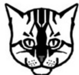
CHARCOAL BENGAL FACE MARKINGS "ZORRO MASK"

CHARCOAL BENGALS HAVE LITTLE OR NO RUFUSING AND ARE DARKER AND GREYER THAN OTHER BENGALS. THEY ARE GREY-TONED RATHER THAN WARM BROWN TONED. THEY TYPICALLY HAVE A "ZORRO" MASK AND A CAPE (WIDE DARK DORSAL REGION).